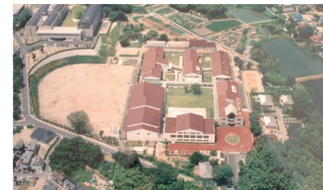
◆三代目庁舎 1996年～現在