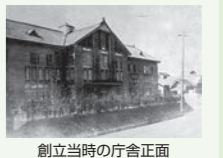
創立当時の庁舎正面

茨木市内にある、我が国で最初に設立された少年院。大正12年に開庁し、令和5年をもって、創立100周年を迎えた。自然に恵まれた静かな環境のなかで、従来の矯正教育に加え、就労支援や修学支援等の社会復帰支援を行っている。