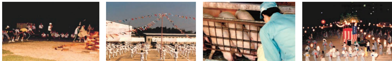
キャンプファイヤー 運動会 畜産（実習） 盆踊り大会