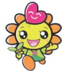
アカルイーネ 「社会を明るくする運動」 大阪府推進委員会キャラクター