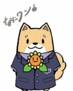
浪速少年院公式キャラクター「なにワン」