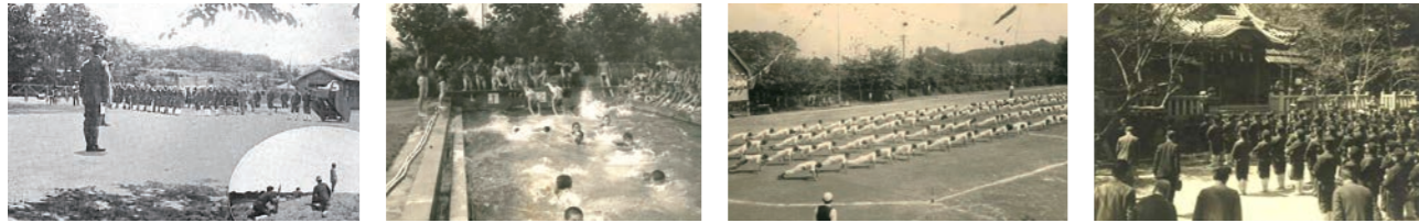
野外発火演習 水泳指導 運動会 氏神詣