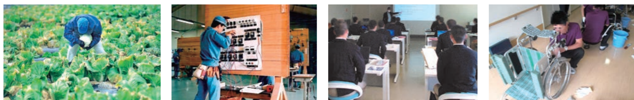
職業指導（農園芸） 職業指導（電気工事） 職業指導（ICT科） 社会貢献活動（車いす清掃）